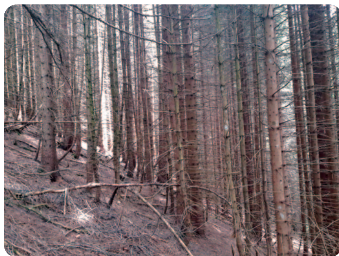
Labile Fichtenreinbestände stocken auf den ehemaligen Mähwiesen

Aufgrund des einsetzenden Schneefalls mussten die Arbeiten im Herbst eingestellt werden. Im vergangenen Jahr konnten 1200 m 3 Holz geschlagen und an die Waldstrasse gerückt werden. Der Brennholzanteil lag bei ca. 50%. Nur dank der kantonalen Schutzwaldbeiträge sind solch aufwendige Holzschläge mit geringer Holzqualität für den Waldeigentümer finanziell tragbar. Die Holzerntearbeiten werden im Frühjahr 2024 abgeschlossen.