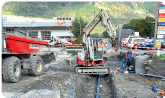
Einlenker Deutsche Strasse

An der Deutschen Strasse mussten die Leitungen als Vorbereitung für den zukünftigen Kreislauf und in den Rheinauen für den Betrieb des Badesees versetzt bzw. tiefer gelegt werden. Da die Leitungen bereits eine bestimmte Lebensdauer erreicht hatten, gehen die Kosten vollumfänglich zulasten der Trimmiser Industriellen Betriebe. Die Aufwendungen zulasten der Wasserversorgung belaufen sich auf CHF 132'302.70 und zulasten der Abwasserbeseitigung auf CHF 73'680.35.