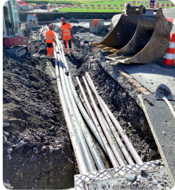
Einlenker Deutsche Strasse

Der Ersatz des Transformators ist noch ausstehend (Lieferverzögerung). Provisorisch wurde der bisherige Transformator angeschlossen.