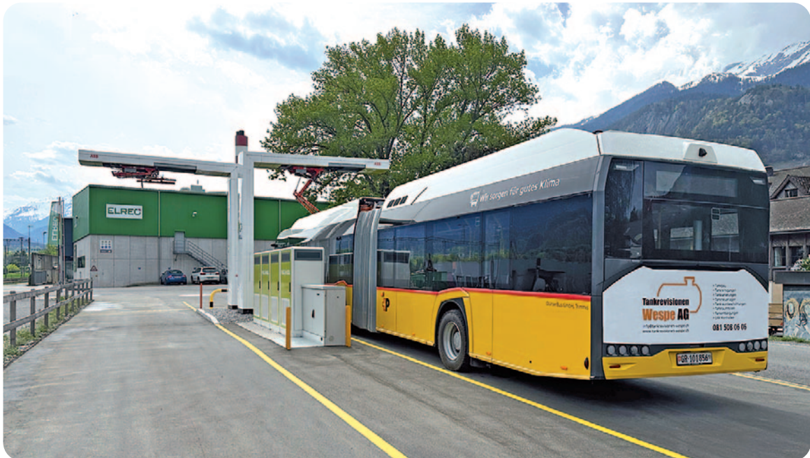
E-Ladestation für Postautos